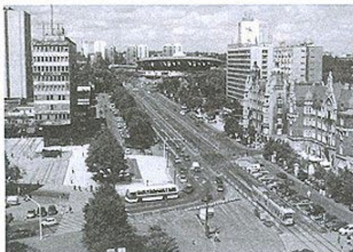
Stolica blisko trzymilionowej aglomeracji potrybuje sprawnej komunikacji publicznej.

„Katowice są miastem przyszłości. Jesteśmy właśnie świadkami przeobrażania się górnośląskiej stolicy z miasta poprzemysłowego w nowoczesne centrum gospodarcze, kulturalne i polityczne. To trudny proces, wymagający ogromnych nakładów inwestycyjnych, równocześnie konieczny, zważywszy że Katowice mają być kluczowym miastem w całym Euroregionie, obejmującym obszar przygraniczny trzech państw: Polski, Republiki Czeskiej i Słowacji. Temu celowi służą nowobudowane drogi, banki i uczelnie. A że świat pędzi naprzód coraz szybciej, jednego możemy być pewni: Katowice jutra muszą powstać już dziś!”