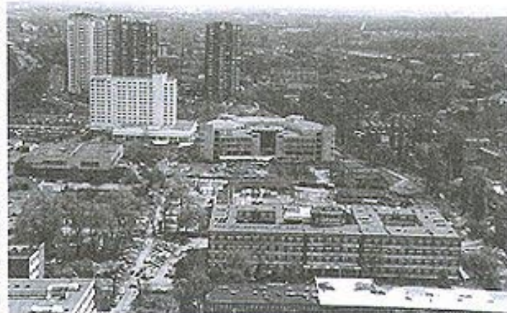
Katowice mają swoje charakterystyczne obiekty architektoniczne. Bez wątplenia należą do nich „Gwiazdy”, a także nowy gmach Wydziału Prawa Uniwersytetu Śląskiego.

Realizacja owego zamierzenia nie od razu przyniosła oczekiwane efekty. Pamiętajmy: miasto przez ponad stulecie było obciążone nieprzyjaznym ekologicznie i starzejącym się przemysłem ciężkim oraz dostosowaną do niego, specyficzną infrastrukturą. Już ten fakt mógł budzić nieufność potencjalnych inwestorów. Potrzeba było kilku lat starań, niezliczonej ilości zabiegów i działań aby przełamać impas i pozyskać odpowiednich sprzymierzeńców oraz partnerów. Dlatego patrząc z dzisiejszej perspektywy na osiągnięcia gospodarcze Katowic ostatniego dziesięciolecia, w tym na zrealizowane w krótkim czasie (i nadal realizowane!) inwestycje trzeba mieć świadomość, że żadna z nich nie jest dziełem przypadku. Są efektem wyłożonej, solidnej pracy i wspólnego wysiłku samorządu, przedsiębiorców oraz oczywiście mieszkańców, jak również umiejętnego wykorzystania walorów, wynikających z naturalnych warunków miasta i wielu sprzyjających zjawisk ekonomicznych. Z tych właśnie powodów w Katowicach, uruchomiło swoją działalność szereg podmiotów, tworzących sieć instytucji obsługi biznesu, które pierwsze docenily zalety tego rynku: sil-