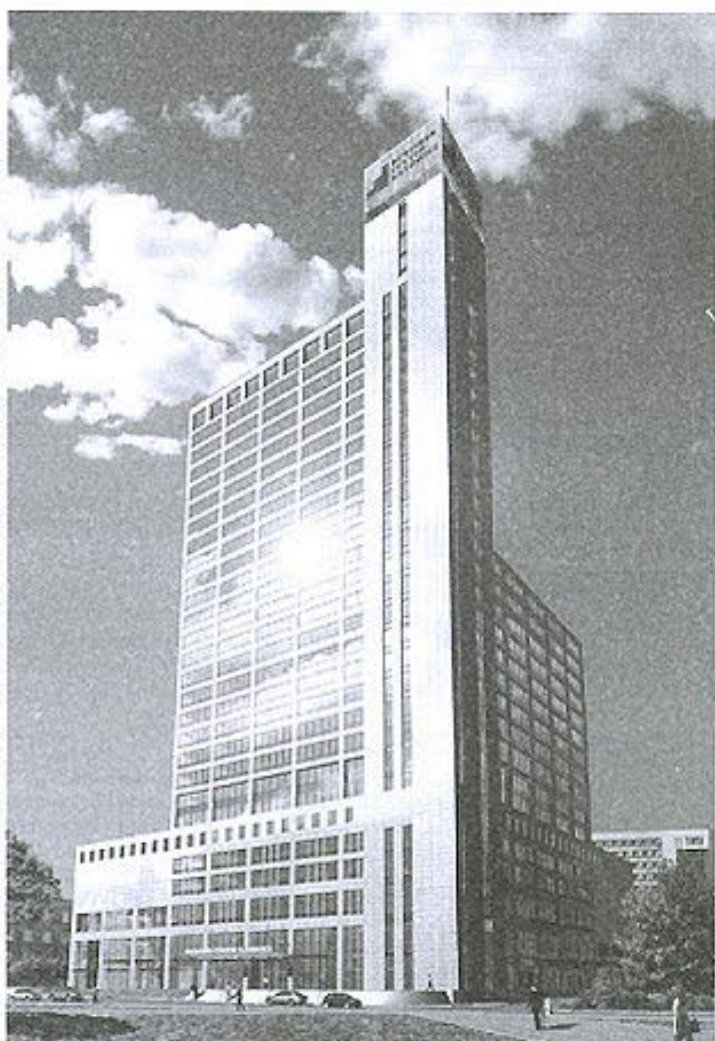
Najnowszy i najnowocześniejszy gmach w Katowicach: wieżowiec Uni Centrum.

Dziś można być już pewnym, że dalszy rozwój miasta przestał być jedynie kwestią ambitnych planów - on się bowiem dokonuje na naszych oczach. Dzień po dniu, jako stały proces, który tak jak we wszystkich miastach nowoczesnej Europy - nie będzie miał już nigdy końca.