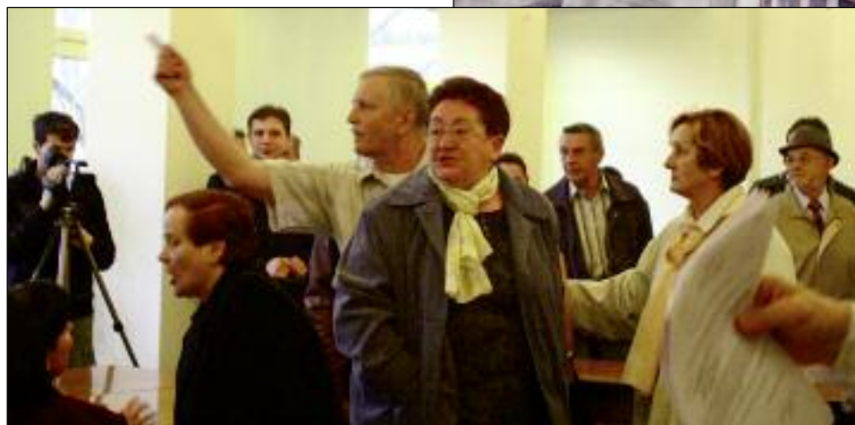
Sejse Rady Miasta poświęcone sprawie mieszkańców bloków przy ul. Mikołowskiej budzą wielkie emocje.