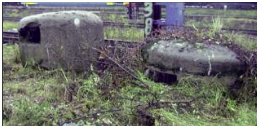
Kochbunkier w okolicy stacji kolejowej w Raciborzu.

Zabawa w wojnę ma wielu przeciwników. Patrząc jednak na entuzjazm aktorów przymierzających mundury albo zbroje i zachwyty widzów, żywiołowo reagujących na jęki „konających” – żywym lekcjom krwawej historii można wróżyć tylko sukces.