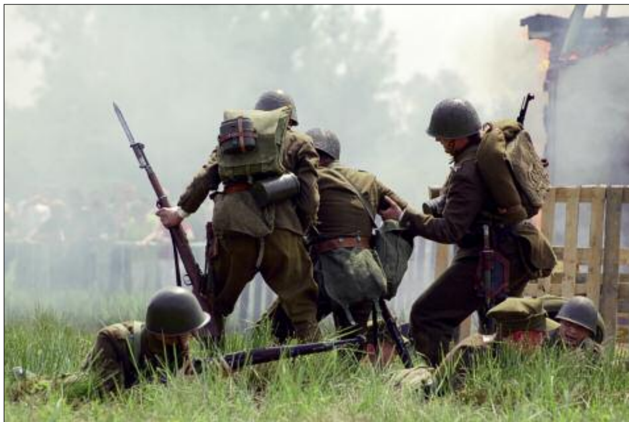
Pro Fortalicjum organizuje największe na Śląsku widowisko batalistyczne - Bitwę Wyrską.

Podobnie, jak w 1945 roku Niemcy w panice uciekną z „kochbunkrów”, a żołnierze niezwykłej Armii Czerwonej z okrzykiem „urrra!” wędrują na linię umocnień b-2, biegnąc przez Trójkąt Trzech Cesarzy. Takie emocje mogą nas czekać już za dwa lata na granicy Mysłowic, Jaworzna i Sosnowca.