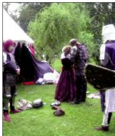
Ryserze szykują się do bitwy.

Powstaje coraz więcej stowarzyszeń zajmujących się zawodowo odtwarzaniem