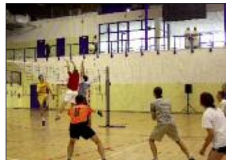
Uczestnicy obozu byli pod wrażeniem naszego regionu i przygotowanych dla nich atrakcji.

Mistrzostwa Europy Kobiet w Koszykówce do lat 16 Dywizja A odbędą się w Katowicach