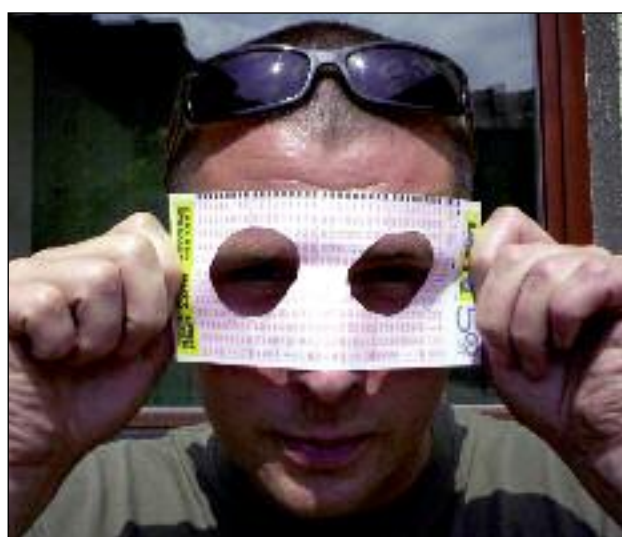
Jaki piękny jest ten świat przez różowe okulary.

Test z monetą fachowcy od rachunku prawdopodobieństwa uznają za zabawę zbliżoną do „totka”, jeżeli chodzi o szansę na wygraną. Dzięki państwowej loterii już 594 mieszkańców naszego kraju wzbogaciło się o siedmocyfrową kwotę. Listę zamyka „pechowiec” z Poznania z okrągłym milionem na koncie. Najwyższa wygrana padła cztery lata temu w Warszawie - ponad 20 mln. zł. Zainteresowanie „kulami szczęścia” rośnie, kiedy w wyniku kumulacji można trafić sumę działającą na wyobraźnię. Tak było ostatnio. Przez kilka lipcowych losowań nikt nie trafił „6”. Nagroda urosła do astronomicznej kwoty ponad 37 milionów złotych, a media podpowiadały, jak wydać taką kasę. Rekord wygranej nie padł, ponieważ szczęśliwy układ liczb wytypowały cztery osoby. Wypadło po dziewięć milionów złotych na głowę. Gdyby taką sumę złożyć na standartowej bankowej lokacie, sam zysk z miesięcznych odsetek wyniósłby aż 48 tys. złotych. W grupie szczęśliwców tradycyjnie nie znalazł się nikt, kto złożył kupon w kolekturze na Górnym Śląsku. Nie ma się zresztą czemu dziwić. 14 miast Górnośląskiego Związku Metropolitalnego liczy w sumie więcej mieszkańców, niż stolica, ale to warszawiakom przy-