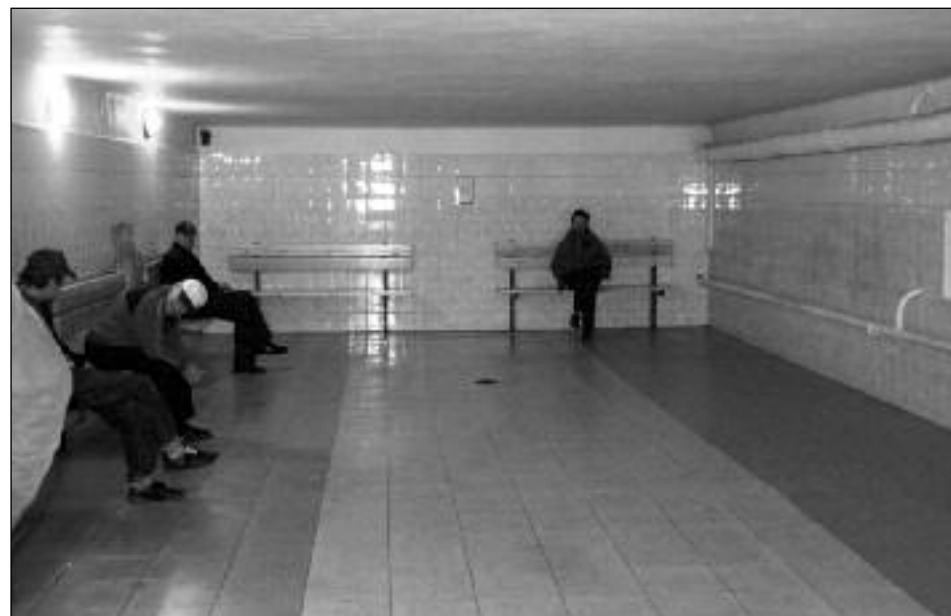
Na własne życzenie niszczą sobie zdrowie i życie, ale dzięki ogrzewalni nie zamarzają na śmierć

Przed uruchomieniem ogrzewalni zawsze pojawiają się głosy, czy jest sens z pieniędzy podatników pomagać alkoholikom, którzy na własne życie rujnują swoje zdrowie i życie. To dobre pytanie i jedyną rozsądną odpowiedzią jest informacja, że w Mysłowicach od sześciu lat jeszcze nikt nie zmarł na śmierć.