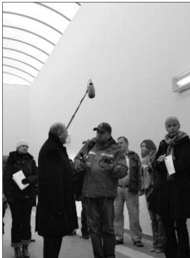
Prezydent z dziennikarzami w tunelu na Zadolu

Prezydent Katowic Piotr Uszok zaprosił dziennikarzy na wycieczkę po mieście, aby pokazać im inwestycje, które udało się ostatnio zrealizować. Na początku było przejście podziemne pod torami kolejowymi na Zadolu. Ten żelbetonowy tunel ma 3,7 m szerokości, 2,6 m wysokości i 130 m długości. Nie zapomniano też o pochylniach dla osób niepełnosprawnych. Na pierwszy rzut oka inwestycja niepozorna i raczej nie wymagająca wielkiego zachodu, okazało się, że przygotowania do jej rozpoczęcia trwały przez kilka lat. Tunel kosztował 12,5 mln zł, a budowano go zaledwie kilka miesięcy.